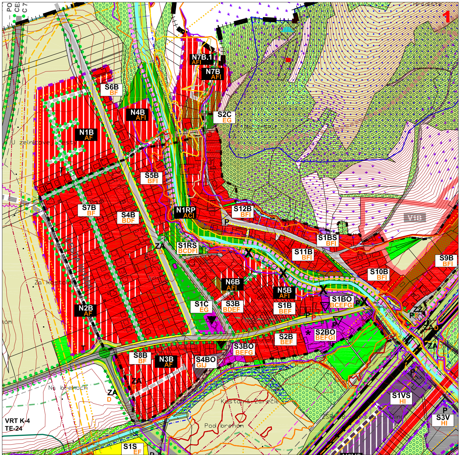
SCHÉMA POLOHY VÝREZU 1