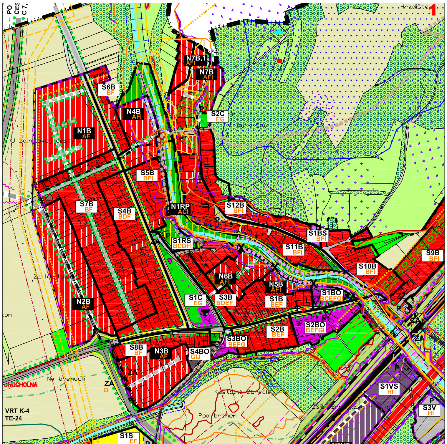
SCHÉMA POLOHY VÝREZU 1